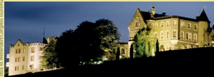
Grandiose Aussicht: Die Festung Marienberg (oben) und die Steinburg mit Blick auf Würzburg, beides Wahrzeichen der Stadt