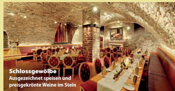
Schlossgewölbe Ausgezeichnet speisen und preisgekrönte Weine im Stein

Frankenwein, Bocksbeutel & Co. prägen weite Teile der Landschaft. Man findet urige Lokale und traditionelle Weinstuben mit regionaler fränkischer Küche. In der Tiefe des Würzburger Steins wurde im Schlossgewölbe ein behaglicher Weinkeller mit massiven Steinmauern angelegt, wo man gute Küche und exzellente Weine, die berühmten Steinweine aller Würzburger Weingüter, reicht.